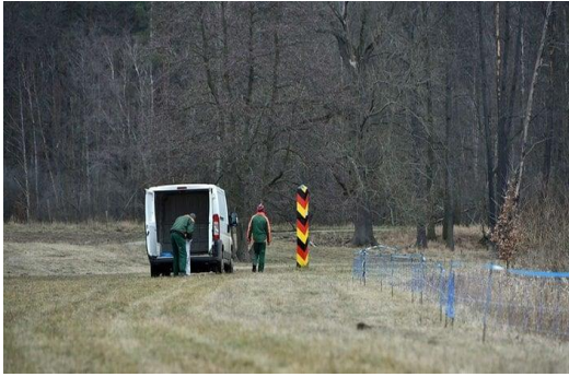
Kontrolle der mobilen „Wildschweinbarriere“ an der Grenze zu Polen